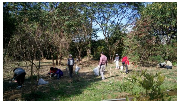
第 1 梯次-106 年 2 月 21 日