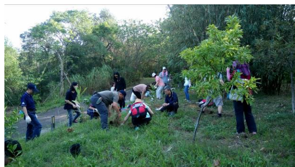
第 3 梯次-106 年 11 月 16 日