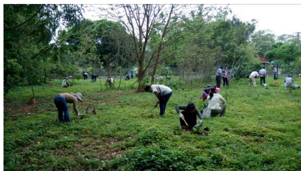
第 2 梯次-106 年 4 月 18 日