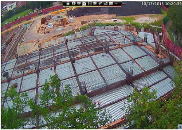
博愛校區生醫工程施工情況-1