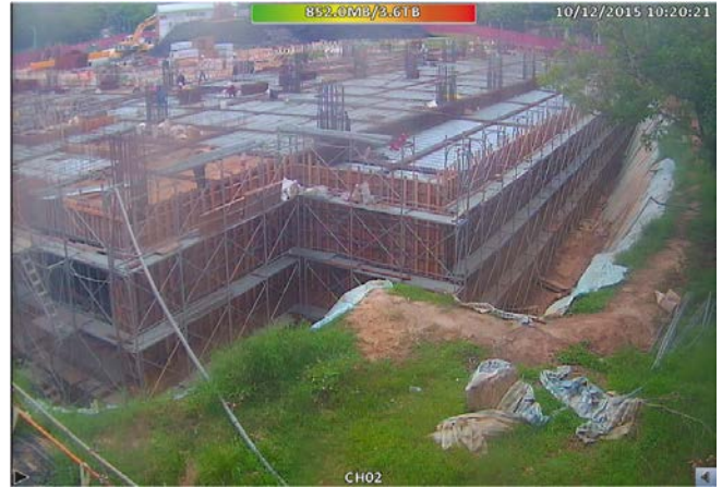
博愛校區生醫工程施工情況-2