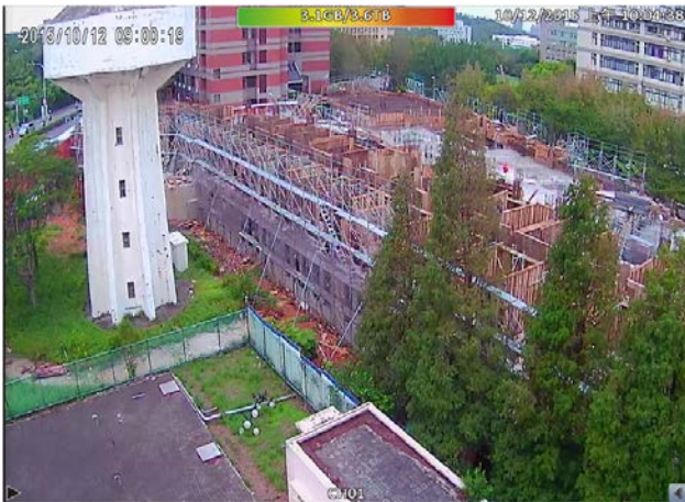
研究生第三宿舍興建工程施工情況-1