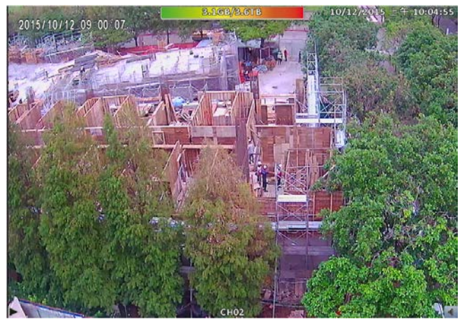
研究生第三宿舍興建工程施工情況-2